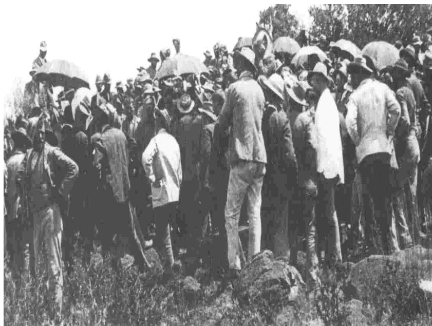
Burgers in gebed, met die sambrele wat so vele van hulle op kommando saamgeneem het vir skaduwee

Daar is duidelike voorbeelde van openlike onverskilligheid. Een dagboekskrywer vertel van 'n burger wat sonder enige aarseling bladsy uit 'n Bybeltjie as sigaretpapier gebruik en dan boonop verklaar dat hy darem die boek Openbaringe geniet.