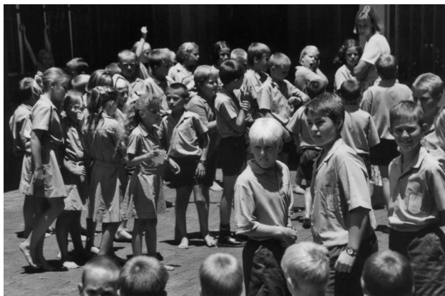
Kinders van die Geref. Laerskool Johannes Calvyn

Deur die jare heen was die finansies en die beskikbaarheid van onderwysers soms 'n kopseer. Tog het die Here altyd weer voorsien in die behoeftes. Daar kan daarom ook vol vertroue na die toekoms gekyk word.