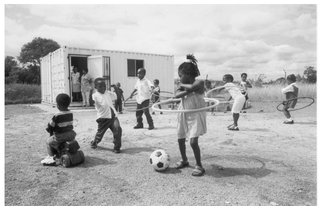
Kinders van die Lesedi-skool op die skoolgronde in Soshanguve.

Die toekoms vir hierdie skool lyk nog onseker. Die ouers wil die kinders 'n Christelike opleiding gee en sou verkies dat dit in Soshanguve plaasvind. Die probleem is egter dat die registrasie van die skool baie teenkanting van die Onderwysdepartement ontvang. Aan die ander kant het die mense in die omgewing van die kerk en skool aangedui dat hulle ten gunste daarvan is dat daar 'n Christelike skool in hulle gebied opgerig word. Daar is dus hoop dat die kinders eendag in hulle eie gebied kan skoolgaan.