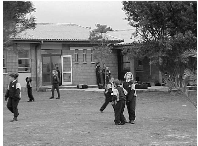
Gereformeerde Laerskool Bellville