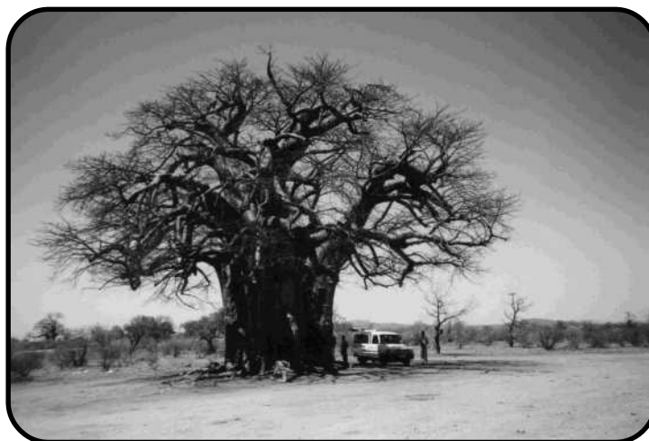
'n Groot kremetart noord van die Limpopo