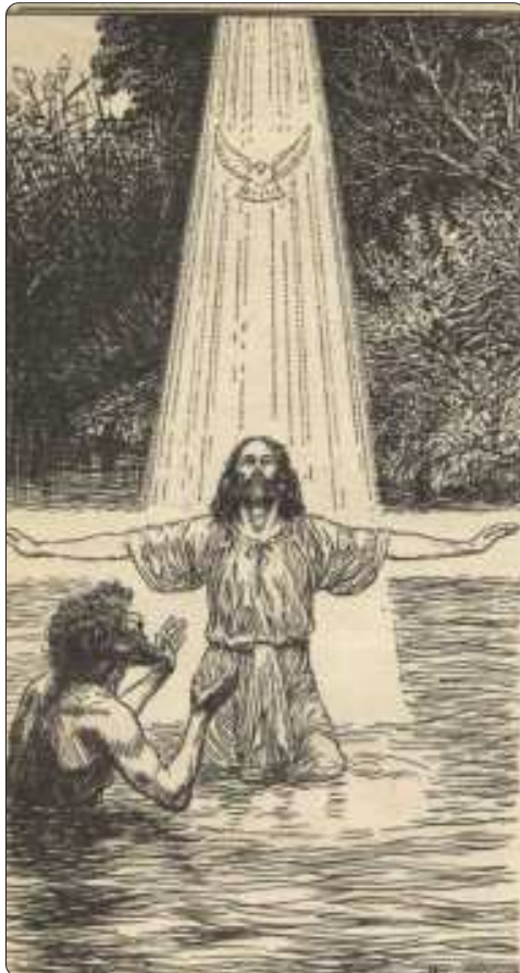
Matt. 3:16 - die doop van Jesus (illustr. C. Jetses)

Here Jesus doop nie net met die Gees nie, maar ook met vuur. Die doop met die Gees dui op die oorvloedige werk van Christus deur die Heilige Gees na sy verheerliking