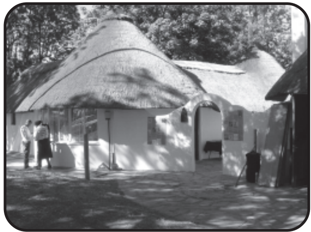
Die kantoor en die kombuis van die tydelike hospies