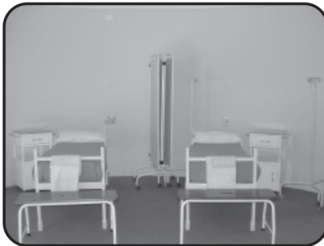
Die vrouesaal van die hospies