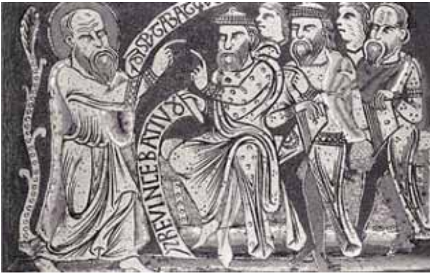
Paulus en die heidene

van sy stamvaders. Sy Joodsheid was vir hom alles. Dit was juis die rede waarom hy die Christelike gemeente met soveel ywer vervolg het.