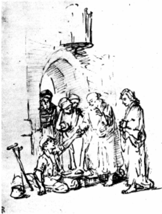
Geld alleen kan nie werklik iemand uit ellende help nie - Rembrandt skildery

Psalm 94 vorm deel van 'n groep psalms wat almal handel oor die koningskap van God, Psalm 93 t/m 99. Hierdie tema is in Psalm 94 nadruklik aanwesig. Die digter besef gaandeweg steeds sterker dat, ten spyte van mense wat goddeloos lewe en selfs die opregtes verdruk, ten spyte daarvan is en bly God Koning. Hy is die Regter van die aarde. Hy kan die God van wraak wees, as reg en geregtigheid herstel moet word. Hierdie benaming – God van wraak – hoef ons nie af te skrik nie. Dit laat mens juis opgelug asemhaal. In die ou Oosterse regsisteem was dit naamlik so onder die nomadevolke dat wanneer iemand vermoor is, dit die reg en plig van die familie was om – volgens bepaalde reëls – wraak te neem. Om die misdadiger dus te straf. In Psalm 94 word die HERE bestempel as die Persoon wat die vergote bloed van weduwee, wees