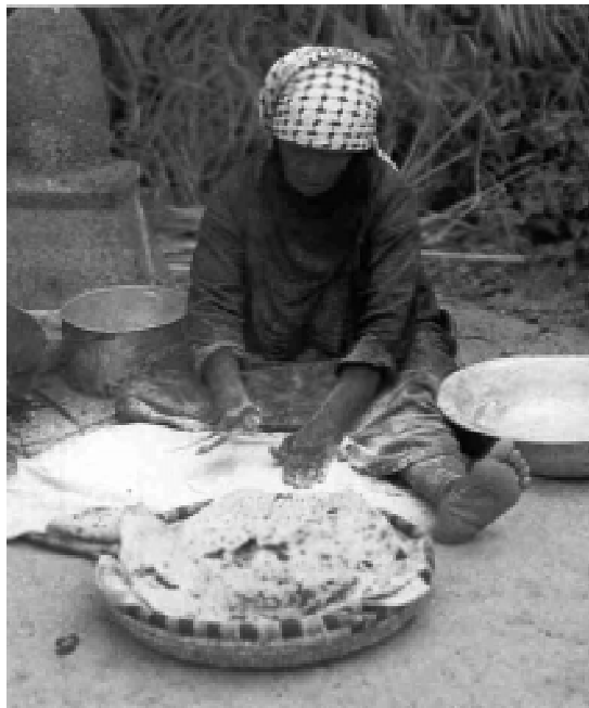
'n Vrou maak ongesuurde brood

Met die koms van Christus intensiver die viering van die Pasga. Die klem op afsonderlikheid gaan oor na totale eenheid. Nagmaal is nou daar waar die gemeente byeen is! Veral die Evangelie van Johannes en die eerste Brief aan die Korinthiërs beklemtoon dié feit. Daarmee kom die simboliek, dat Christus midde-in