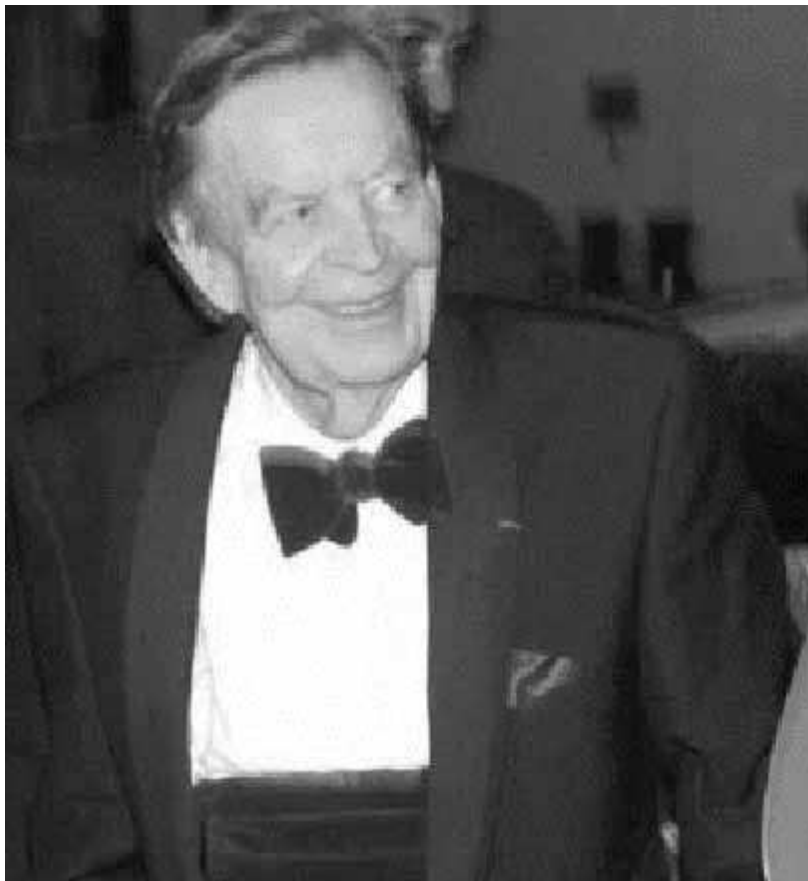
Dr Anton Rupert. 4 Oktober 1916 - 18 Januarie 2006