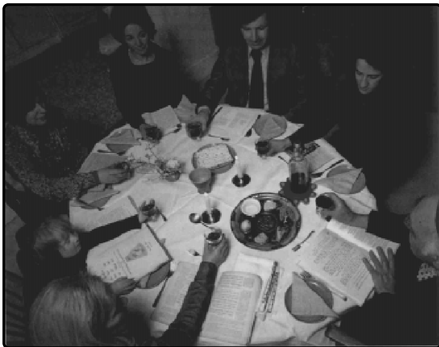
'n Moderne Joodse gesin vier die Paasfees

Dieselfde geld ook vir die besnydenis wat 'n skadubeelde was van ons reiniging in Christus (Kol 2:10-13).