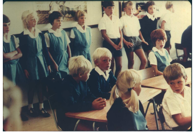
Eerste skooldag van die GLB – Januarie 1977

kan miskien begryp word dat ek dié jare as van die swaarste van my onderwysloopbaan beskou.