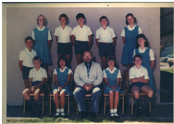
'Oudste' klas: St 4 en 5 – 1980

Laagtepunte? Kerklike moeites (kyk by vraag 1), die gevoel van geïsoleerd-wees, die vraag hoe 'n mens aan die onderwys vorm moet gee sodat dit ook deel word van die Afrikaanse samelewing sonder om jou beginsels prys te gee en met baie beperkte middele en menslike beperkings en tekortkomings.