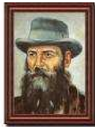
DE LA REY

skree die profete nog 'n bietjie harder. Afgode is hol goed, leeg. Sing jy dan nog 'n bietjie harder, sing dit nog 'n keer: De La Rey, De La Rey, sal jy die Boere kom lei? Generaal, generaal ... leer dit vir die kleintjies, bal jou vuus en voel hoe jou hart klop. Ek dink ek begin onthou wie ek is. Ons almal weet ons wil dalk weer Boere wees. Sonder dié Man beteken jou lied niks. Dit is blote afgodiese liturgie in die winkelsentrum-tempel. Dit is lewensgevaarlik, want jy bid nie; jy roep nostalgies 'n leier uit die as op. Hoe baie is die demagogiese dwase wat so graag op jou roepstem wil antwoord gee. Daar sal vele kandidate wees, en jy sal soos een man om hul val, terwyl jy soos een man om dié Man, die Verbondshoof en Hoof van die skepping, Jesus