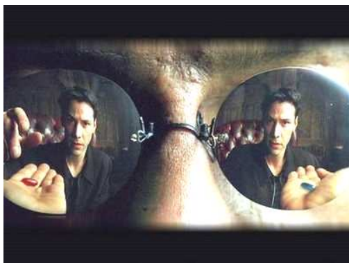
(rooi pil links, blou pil regs)

Byvoorbeeld: Word egbreuk goedgekeur? In baie sogenaamde "chick-flicks" (romantiese komedies wat afspeel in 'n hoërskool of kollege) word maagde as sosiale uitwerpsels gesien en word hulle belaglik gemaak. Die karakters maak 'n 18-jarige maagd belaglik, omdat sy nog nooit seksuele omgang gehad het nie. Gesien die teikengroep van hierdie films (hoërskoolleerlinge, veral meisies), moet 'n mens baie versigtig wees vir sulke films. Voorhuwelikse seks word geleidelik as normaal in die kykers ingeprent, met die gevolg dat baie tieners al vroeër 'n seksuele behoefte het en baie druk ondervind om seksueel aktief te wees.