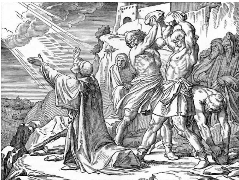
Steniging van Stefanus (Hand 7)

Gebed tot ons een Here is die belangrike saak en daarin wil ons juis deur ons gebed tot die Seun van die mens ons duidelik onderskei van hulle wat Jesus nie as die Gesalfde van God wil erken nie. Ons gebede tot die Gees is noodsaaklik om Hom as ons Here te erken wat veel meer as net 'n krag is wat van God uitgaan. Hy is Self Here en word saam met die Vader en die Seun aanbid (Geloofsbelydenis van Nicea). Ons hoef hier geen kunsmatige kompartementering aan te bring en byna 'n angstigheid te hê wanneer ons bid nie. Laat ons bid!