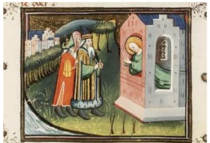
Daniël in gebed

Dit is nie net 'n gewoonte om jou gebed af te sluit met: om Jesus ontwil nie.