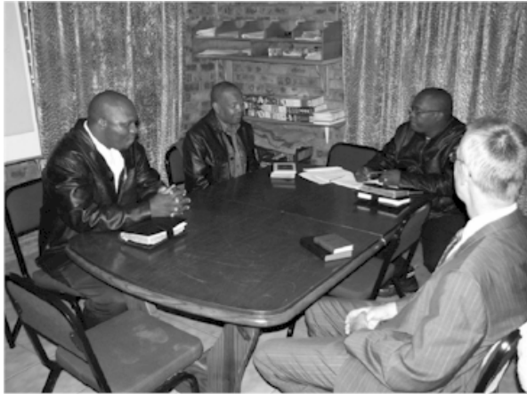
Kerkraad Mamelodi met hul nuwe sendeling

word voor ons oë geskiedenis gemaak: die kerkraad van Mamelodi – nog nie so lank gelede nie self nog sendingkerk – neem verantwoordelikheid vir hulle eie sendingwerk in Nellmapius!