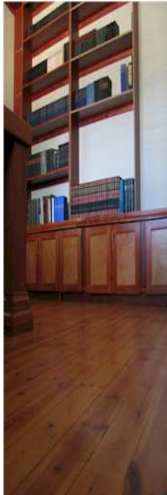
'n Klassieke, stylvolle interieur getuig van 'n kwaliteit atmosfeer.

Ons hoop en bid dat dit wat studente uit AROS put en mag saamneem die lewe in, van onskatbare waarde