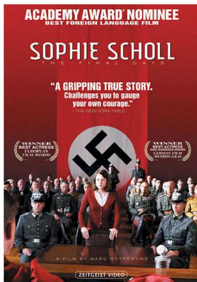
Die film Sophie Scholl – the Final Days

Die groep het hulself Die Weisse Rose genoem. ('n Interessante feit is dat Luther se persoonlike simbool ook 'n wit roos was). Sophie se broer Hans het 'n leidende rol in hierdie beweging gespeel. Hulle het duisende pamflette versprei waarin hulle die Duitsers opgeroep het om passief die Nazi's teen te werk.