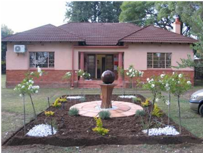
AROS-huis, die hart van die nuwe opleiding

Agter die mure in Dickensonlaan is daar 'n stukkie bekoring aan die werk. Wind deur die hoë bome, die geklank van dowwe houtvloere, donkerhoutmeubels wat getuig van