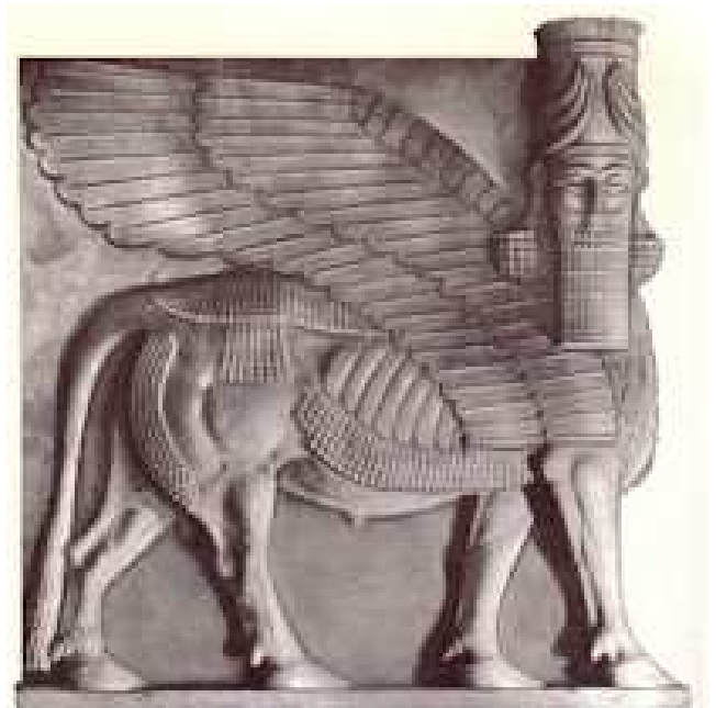
Koning Sargon II van Assirië, uitgebeeld as gevleuelde bul ... 'n gevleuelde sprinkaanplaag?

de tyd as wat die priesters van Sion treur (1:13). Die hele "wêreld" (2:21), die ganze natuur (2:22), sal bly wees as God die ramp afweer.