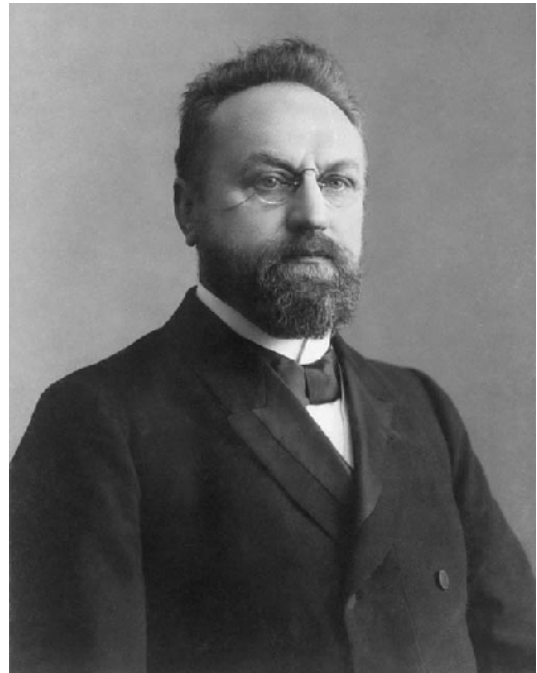
Dr Herman Bavinck

volgende dele verskyn en vroeër hierdie jaar is die projek voltooi toe die vierde deel die lig gesien het. Vir al die mense wat nie Nederlands kan lees nie, is Bavinck nou beskikbaar in Engels. Dit is 'n mylpaal, veral vir Noord-Amerika, maar ook wyer.