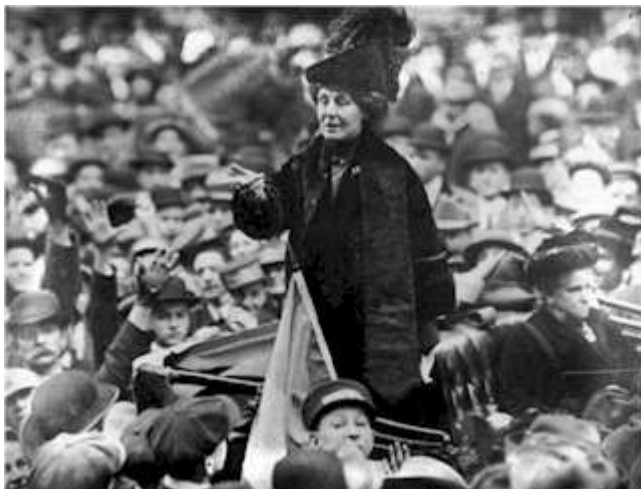
Emmeline Pankhurst spreek 'n skare toe in 1911. Sy was een van die stigterslede van die Britse suffragette-beweging.

standhede in die tekstielbedryf. Waarby in 1911 dan veral aandag gegee is aan die totaal onvol-doende veiligheidmaatreëls.