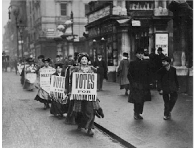
Vroue adverteer 'n suffragette-vergadering.

Die plakkate wat saamgesleep is, het die eise bekend gestel: korter werkure, beter betaling en stemreg vir vroue! Vir die eerste keer word daar nou by die sosiale en maatskaplike eise 'n politieke eis gestel.