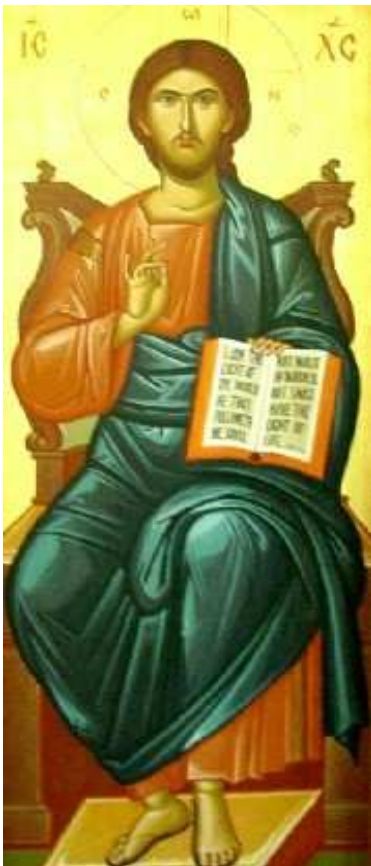
Christus as wetgewer uit 'n griekse ortodokse ikoon

Dit is nooit asof ons nog nie aanspreekbaar is totdat 'n gebod sy opwagting maak nie. Ons word nie tot gehoorsaamheid in beweging gebring deur die hefboom van die gebod nie. Die gebod is 'n ligwerper op Wie God is en wil ons daarmee in beweging bring. Miskien lê hier die rede vir ons dikwels trae gehoorsaamheid aan die Here. Ons gehoorsaamheid behoort die karakter van blymoedige aanbidding te hê. Aanbidding in gehoorsaamheid aan 'n genadige en liefdevolle en majestieuse God. Maar solank as wat ons ons verkyk en vaskyk in 'n gebod sonder om die liefdevolle en grote Here self raak te sien, word ons reaksie dié van 'n slaaf en word die wet 'n slawedrywer.