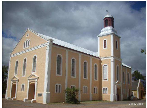
Kerkgebou op Genadendal, die eerste sendingstasie in Suid-Afrika

Die feit dat die sendingwerk hervat kon word, was te danke aan 'n verandering in regeringsbeleid aan die Kaap. Voortaan is meerdere kerkgenootskappe in die Kaap toegelaat. Dit het 'n geweldige instroming van sendingsgenootskappe in die 19de eeu tot gevolg