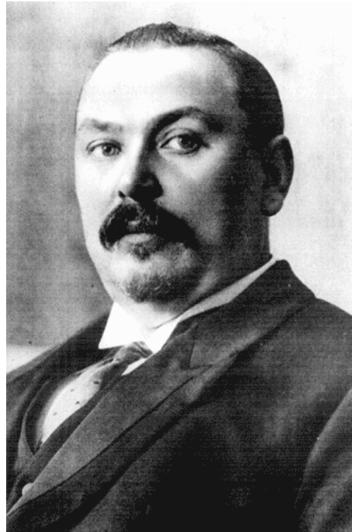
Genl Louis Botha

sentrale gesag te vestig. Een van die mees kontroversiële wetgewings wat deur die nuwe regering aangeneem is, was die Naturelle-grondwet van 1913. Die wet het bepalings gemaak oor die aankoop, huur, besit en bewoning van grond deur alle bevolkingsgroepe in Suid-Afrika. Dit het groot gevolge gehad vir die werkstoestande van swartes in landelike en stedelike gebiede. Die wet het ook die grondslag gelê vir die 'Tuisland'-stelsel, waar elke 'stam' in Suid-Afrika 'n gebied toegeken gekry het waar hulle mog woon. Alhoewel die grootste gedeelte van die bevolking in Suid-Afrika uit swart mense bestaan het, het die 'Naturelle-gebiede' minder as 8% van die grondoppervlakte van die land beslaan. Die 'Naturelle-grondwet' het dus effektieflik die land verdeel. Alhoewel Suid-Afrika dus geografies verenig is met die Uniewording, het die eerste jare ook tot verdeeldheid gelei.