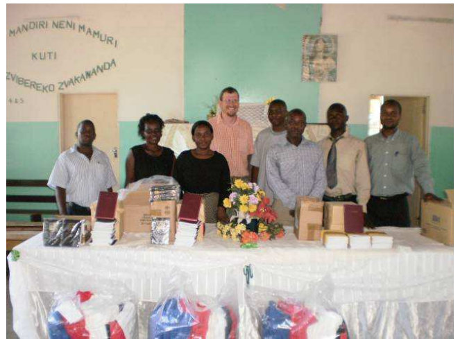
Figure 1: Lede en leiers van die Reformed Church of Zimbabwe en CCAP in Chiredzi