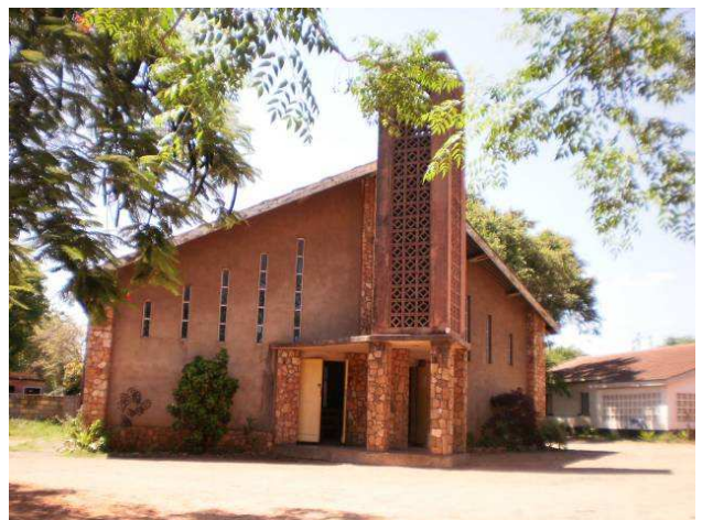
Reformed church of Zimbabwe in Chiredzi