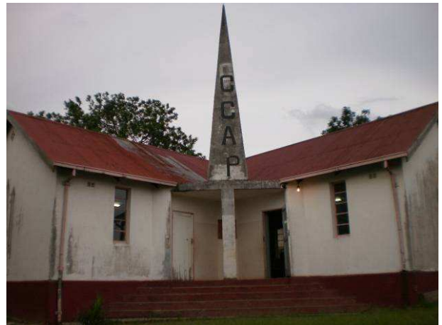
CCAP in Mutare