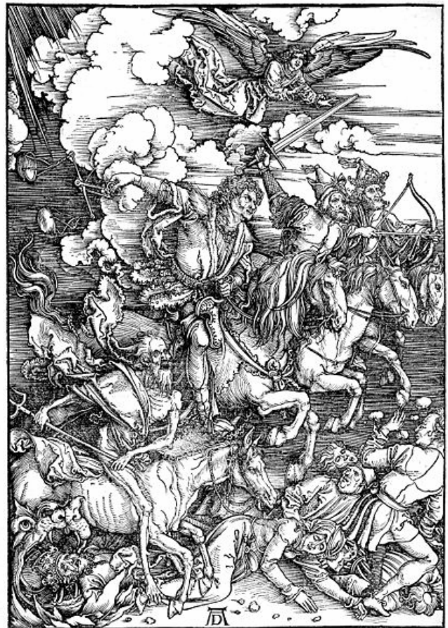
"Another horseman on the run" Die vier ruiters van die Apokalips (ca 1497) Albrecht Dürer, houtsnee

Die tweede laaste plek wat genoem word, is Armageddon . Hierdie is nie 'n plek wat 'n mens op 'n wêreldkaart sal kry nie. Die plek word genoem in Openbaring 16:16 en word beskou as 'n plek waar die laaste veldslag van hierdie aarde sal plaasvind. Dit word afgelei van Openbaring 16:14 waar geskryf staan: " Want dit is die geeste van die duiwels wat tekens doen, wat uitgaan na die konings van die aarde en die hele wêreld, om hulle te versamel vir die oorlog van daardie groot dag van die almagtige God ". Teoloë verskil oor waarop Armageddon dui. Waarskynlik staan dit simbool vir die groot (eind)stryd tussen die magte van die kwaad en Christus en sy kerk. Ons is nou al in die periode van die eindtyd.