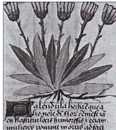
'n Illustrasie in een van Kaethe se kruidboeke.

Tydens die pes-epidemie in 1527 weier Luther om Wittenberg te verlaat. Hy en Kaethe ondersteun juis die pasiënte aktief.