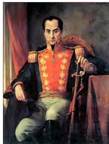
Simón Bolívar (1783–1830)

Wat is die Bybelse riglyne vir sosiale geregtigheid en is dit versoenbaar met Bolivarianisme? ‘n Goeie riglyn vir sosiale geregtigheid vind ons in die boek Amos. Die profeet spreek die oordeel uit oor die volk Israel,