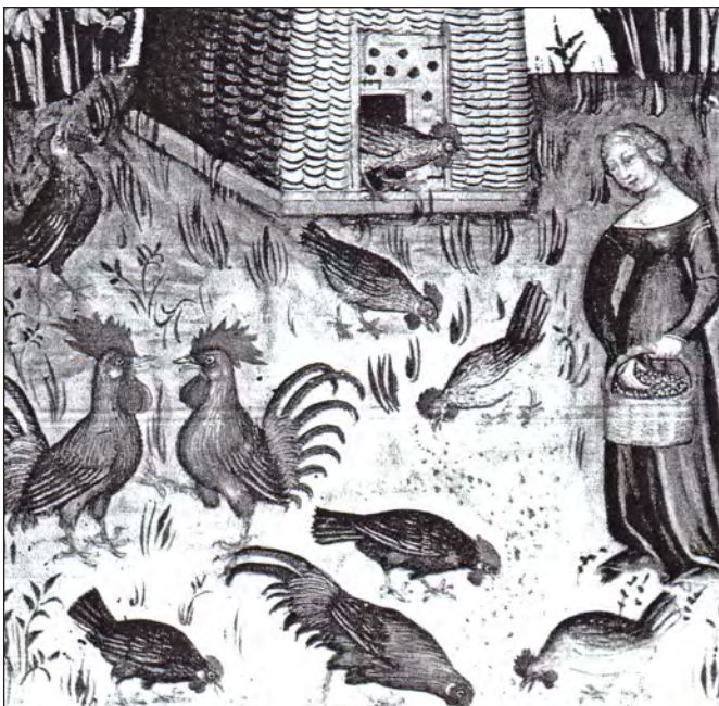
Pluimvee vir die tafel

In Junie 1526 word Johannes (na Johannes die Doper vernoem) gebore. 'n Welgeskape seun. Hans bring vir Luther en Kaethe ongekende blydskap. Luther vind dat die Here hom deur hierdie kindjie baie wysheid leer. Kaethe geniet die moederskap intens. Haar eie tante Lene wat ook die klooster verlaat het, kom woon by hulle in en help met die versorging van Hans en die latere kinders. Elisabeth (vernoem na Johannes die Doper se moeder), die tweede baba, sterf jonk as gevolg van swak gesondheid. In 1529 word daar weer 'n dogter gebore, Magdalena. Luther stap graag met die kleintjie in sy arms rond en sing met sy diep baritonstem allerhande liedjies wat hy self uitdink. Soos wat die kinders groter word, kry hulle privaat onderwys. Die gesin kom elke dag saam om Bybel te lees, te bid en te sing. Later word daar nog twee seuns en 'n dogter gebore: Maarten, Paul(us) en Margaretha. By die doop word daar vir elke kind 'n hele paar peetouers aangewys, gewoonlik van hoë aansien en edeles. Die kinders ontvang geskenke en silwer doopbekers.