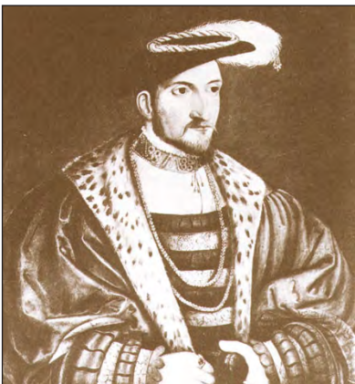
Frederik III, 'Die Vrome'

mense en ook van geskrifte. En as sodanig, dus as 'n dokument van die sorg van Christus oor sy kerk, is ons nog altyd dankbaar dat ook die Heidelbergse Kategismus (HK) in daardie vergaderingswerk 'n plek gekry het.