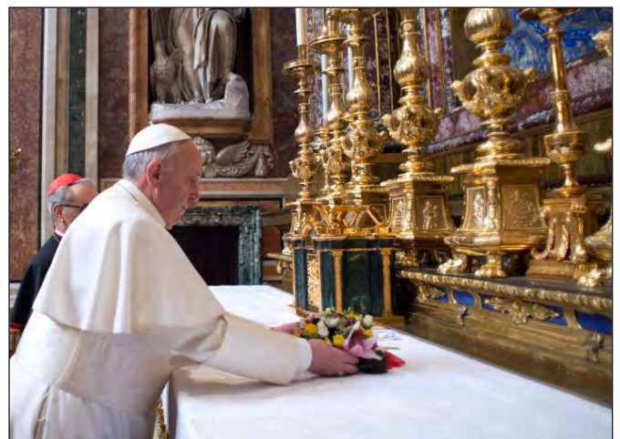
Die nuwe pous lê 'n ruiker by die voete van die afbeelding van Maria

dit inderdaad 'n verskriklike probleem. 'n Mens kan argumenteer dat die Rooms-Katolieke Kerk 'n deel van die skuld moet dra weens sy weiering om afstand te doen van die vereiste van selibaatskap vir priesters, en weens sy traagheid om op te tree teen 'probleempriesters'. Maar watter seksuele misbruik ook al voorgekom het, tog is dit klaarblyklik nie iets wat die Rooms-Katolieke Kerk self onderskryf nie. Die punt is dat daar fundamentele probleme met die Rooms-Katolieke Kerk is omdat die Kerk amptelik stellings ingeneem het wat strydig is met, of die grense oorskry van, die Woord van God. Dit is in die besonder op hierdie gebiede waar reformasie nodig is. Kom ons kyk na drie van die belangrikste kwesies.