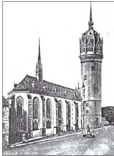
Die slotkerk in Wittenberg waar die 95 stellings aangebring is. Luther lê binne-in begrawe.

Luther se gesondheid het agteruitgegaan. Tog verhoed dit hom nie om die stryd voort te sit nie. Keiser Karel V maak oorlog teen die Protestante. Kaethe vind Luther baie somber en hy praat dikwels oor die dood. Hy gaan weer op reis om in Mansfeld twee Grawe met mekaar te versoen. Kaethe is wanhopig. Die feit dat Luther sy oudste twee seuns, wat alreeds steunpilare is, saamvat, gee haar effense gemoedsrus. Sy kry gereeld briewe van hom. Hy spreek haar altyd aan met speelse titels soos: My lieve Herr Kaethe, Frau Doktorin Katherin Lutherin. Dit neem