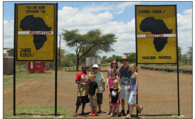
By die ewenaar

ons lekker getoer met die kinders op na die noorde by die mere in die Rift Valley verby.