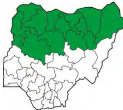
Moslem-state in noord-Nigerië

Die twiste, terreur en burgeroorlog in Nigerië word verder aangevuur deur fundamentalistiese Moslems wat, net soos Boko Haram, meen dat die Islam met geweld beskerm en versprei moet word deur