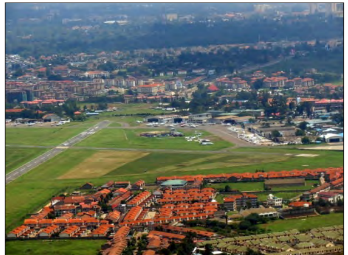
Wilson-vliegveld met MAF-hangaarheel regs