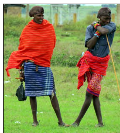
'n Paar Masais, een van die kleiner bevolkingsgroepe

Die nuwe president (Uhuru Kenyatta) het die verkiesing in Maart met 'n paar duisend stemme gewen, uit 'n totaal van 14 miljoen stemgeregtigdes. Dit is natuurlik verdag en die teenstander het 'n klag aanhangig gemaak in die hof. Die hof het die aanklag verwerp. Kenia is die helfte van Suid-Afrika in oppervlakte en het omtrent 43 miljoen inwoners en is daarmee amper twee keer so dig bevolk as Suid-Afrika. Daar is baie bevolkingsgroepe, soos die Kikuyu, Luo, Kamba en vele meer, tot die kleinste groep toe, die el-Molo met net omtrent 500 mense. Hierdie verskeidenheid is ook die oorsaak van baie probleme in die land en is al deur presidente soos Moi gebruik om tweedrag te saai om self aan die bewind te bly.