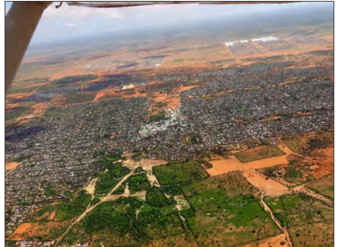
Deel van Dadaab se vlugtelingekamp