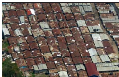
Klein stukkie van Kibera-township

Die woonomstandighede is verskillend, dit hang maar af van waar jy woon, net soos in Suid-Afrika. Daar is mooi buurte met groot huise en tuine wat herinner aan die koloniale tyd, daar is compounds waar 'n aantal huise een hek deel, soos komplekse hier, daar is baie woonstelle en ook townships , soos Kibera en ander. Omstandighede in laasgenoemde is haglik en vergelyk baie sleg met plekke soos ons hulle ken, byvoorbeeld Soshanguve. Ons kinders woon in 'n compound , saam met hoofsaaklik ander buitelanders wat kom uit Finland, Australië, Engeland en Amerika. Groot winkelsentrums is daar genoeg, asook ander moderne fasiliteite.