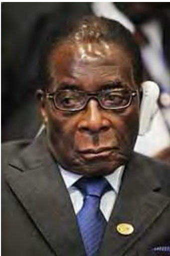
Mr Robert Mugabe

Zimbabwe het oor die jare in 'n groot ekonomiese krisis beland met geweldige devaluasie van die Zim-dollar. Teensinnig het die regering besluit om hul dollar aan die VSA-dollar te koppel (eie materiële belange is tog nog belangriker as hul politieke ideologie teen die Weste). Die gevolg is dat inflasie nou weer onder beheer is. Ongeveer 80% van die bevolking van Zimbabwe is werkloos, maar daarby moet onthou word dat ongeveer 4 miljoen van die 13 miljoen Zimbabweërs inmiddels die land verlaat het en dat baie Zimbabweërs op die platteland 'n bestaansboerdery het, wat vir hulle kos oplewer. Na skatting bly 3 miljoen van die 4 miljoen gevlugte Zimbabweërs in Suid-Afrika. Volgens mnr Mugabe is die ekonomiese verknorsing van die land die gevolg van die boikot deur die Weste en is daar geen sprake van wanbeleid deur sy regering nie.